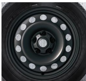
15 PO EN ACIER 12.* Pirelli ™ W210 Snowcontrol 3, 175/65 R15 84H

ENSEMBLES DE ROUES POUR TEMPS FROID HOMOLOGUÉES