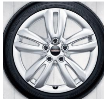
17 PO À RAYONS JCW TRACK 501.* Dunlop ™ SP Wintersport 4D, Affaissement limité, 205/45 R17 88V

Pour les modèles Cooper et Cooper S seulement.