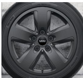
16 PO À RAYONS REVOLITE 517, GRIS FONCÉ.* Goodyear ™ Ultra Grip 8 Performance, 195/55 R16 87H

Pour les modèles Cooper seulement. Pas pour les modèles 2021 et plus récents avec SA2TF et SA541.