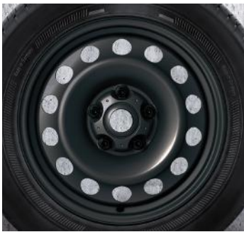
15 PO EN ACIER 12.* Pirelli ™ W210 Snowcontrol 3, 175/65 R15 84H