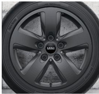
16 PO À RAYONS REVOLITE 517, GRIS FONCÉ.* Goodyear ™ Ultra Grip 8 Performance, 195/55 R16 87H

Pour les modèles Cooper seulement. Pas pour les modèles 2021 et plus récents avec SA2TF et SA541.